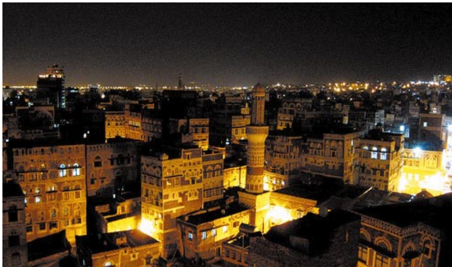
صنعاء في ليلة رمضانية