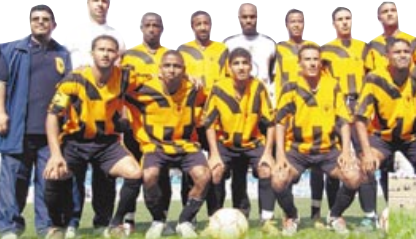
من عدن، وفاز الشطرية على ضيفه بنا ابي بن بضريرات الترحيح ٣ / ١، بعد أن انتهى الوقت الأصلي للمباراة بالتعادل الإيجابي ١ / ١، وتغلب شباب البيضاء على مضيفه وحدة شحير بثلاثية نظيفة، وفاز الشعلة عن على مضيفه تضامن القاعدة بهدفين نظيفين، وفاز وقتها بين بضريرات الترحيح ٥ / ٣، بعد انتهاء المباراة بالتعادل السلبي دون أهداف.

● صنعاء-مأبجة-ريام-مشخاب. تأهل ١٣ فريقاً كروياً الى دور الـ ٣٢ من بطولة كأس الوحدة لكرة القدم في ختام مباريات الدور الـ ٦٤. لتضام في ١٥ فريقاً تاهلت في بطولة كأس الوحدة تعد مسابقة كروية جديدة تم استحداثها لأول مرة هذا الموسم وتقرر ان تقام سنوياً لفريقي الدرجتين الأولى والثانية ويمثل المحافظات (الثالثة.. وقد تضمنت قائمة الفرق المتأهلة في هذه التصفيات فرق التلال والصقرو والسلام وصعدة والشطرية وشباب البيضاء والشعلة وفحصان آبين واتحاد البيضاء ٢٢ مايو وشباب عدن على حساب فرق البجير الجيد آبين وسهام المراوعة والمياد عدن وبنا لوج ووحدة شحير وتضامن القاعدة وطلعة لحوج ووحدة عدن وريدان شبوة ووحدة تريم الحوت الوطني.