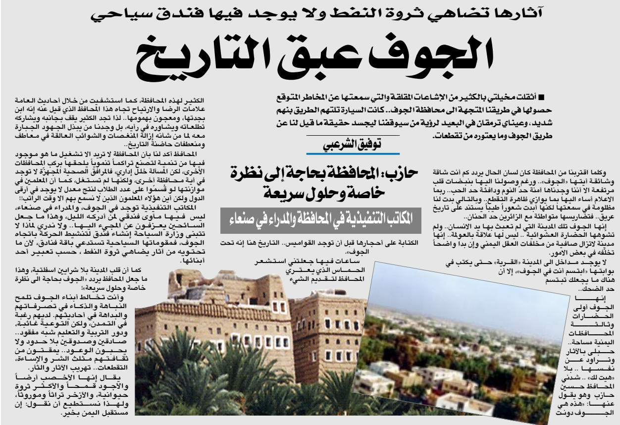
أثارها تضاهاي ثروة النفط ولا يوجد فيها فندق سياحي

المكاتب التنفيذية في المحافظة والمدراء في صنعاء