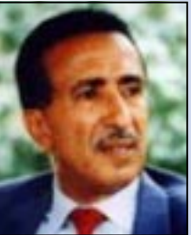
المناضل / يحيى المتوكل