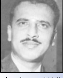
المناضل / محمد علي هيثم