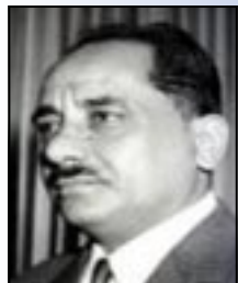
الشهيد / قحطان الشعبي