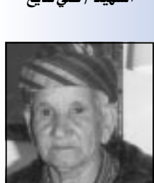
الناضلة / دصرة

الأخيرة عدد من دعاة التشرذم والانقسام على الجانب الآخر.. لا أقل إذا.. ونحن نستقبل الذكرى السابعة والأربعين لثورة السادس والعشرين من سبتمبر عام ١٩٦٢م، من أن نستخلص من مثل هذه المناسبات التاريخية.. حكمة التاريخ، لنذكر أهمية أن نستنهض هممنا في مواجهة هؤلاء المترصين بكل عود أخضر بين ربوع أرضنا الطيبة، سواء ممن يريدون العودة بنا إلى ظلام حكم الإمامة الكهنوتي إياه، أو ممن يريدون العودة بنا إلى ما قبل الثنائي والعشرين من مايو عام ١٩٩٠م.. فكم نحن بحاجة - أكثر من أي وقت مضى - إلى بناء جيل يمني جديد وعياً من جيل سبق، وأكثر صلابة من جيل سبق، وأكثر توحداً بعميق ثوابته ومعتقداته من جيل سبق، وأكثر قدرة على مواجهة التحديات من جيل سبق.. وكل عام وبعيننا الحبيب بالف خير.