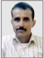
بشره تلك الأشياء القديمة.. حين يهبط الليل يتفلسفون الصعاء.. منكين من تقمصهم طيلة النهار دور الضحية.. وارتداء قناع سلمية الضلال.. يدبون إلى وضاعة حقيقتهم.. تتعالى قهجات ضحكهم فحرج بقرب موعده ممارستهم لجسامهم الليلية.. يتقاطرون كارتزقة..

في الصباح يصطفون بحدوثون برداء زيف الشعارات خلف قناع ما يسمى بالحراك وجوه تشع سفها وخداعا.. تتدلى الستهم وتفوح دنساً ونجاسة.. رأيت بعضهم ذات يوم فسي حراج احد الأرصفة يبيعون ضمانتهم وبعض أسيانهم القديمة يساومهم «المحرج» ويساومونه .. يتسنى صالح علي الحشني السنزلال بالقبول