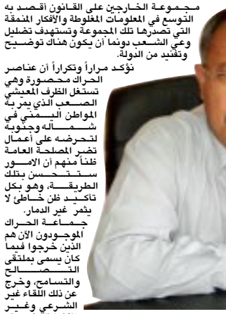
مجموعه الخارجين على القانون أقصد به التوسع في المعلومات المغلوطة والأفكار المنقطة التي تسخرها تلك المجموعة وتسهدف تضليل وهي الشعب يوماً إن يكون هناك توضيح وتفيد من الدولة.

مؤكد صراً وتكراراً أن عناصر الحراك محصورة وهي تستغل الظرف المعيشي الضيق الذي يمر به المواطن اليمني في شحونه وتعرضه على أعمال تخريب الصلحة العامة لغرضها من الأوسور ستمسحس بلكه الطريقة، وهو بكل تأكيد ظن خاطئ، لا يطر غير العمار.. ضماصة الحراك الموجودون الآن هم الذين أخرجوا فيما كان يسمى بملقني التصحيح والتسامح، وخرج عن ذلك اللقاء غير السريع وغير الأخلاقي فكرة أن دم الجنوبي على الجنوبي حرام، وهي منذ إنشائها في اليوم الأول محكومة عليها بالفشل وذلك لإنشائها في وأخلاقية وطنية واذنية.