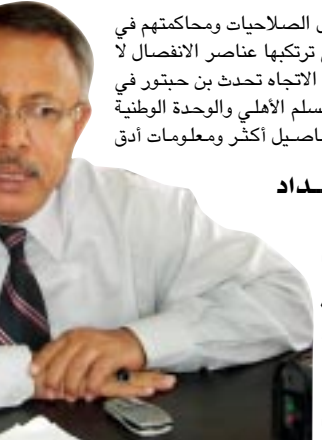
طالب رئيس جامعة عدن أ.د عبدالعزيز بن حبتور بمنح المحافظين كامل الصلاحيات ومحاكمتهم في حالة التقصير في أعمالهم وعدم منحهم للفضوى.. وأكد أن الجرائم التي ترتكبها عناصر الانفصال لا يجب السكوت عنها، وعلى الدولة أن تلقي القبض على القتلة.. وفي هذا الاتجاه تحدث بن حبتور في أكثر من قضية تتعلق بالهم الوطني وما يستجد على الساحة من تحديات تهدد السلم الأهلي والوطنية بأسلوب نقدي بناء ومشغوق بالمعالجات الممكنة للوضع الراهن وفي اللقاء الآتي تفاصيل أكثر ومعلومات أدق وأشمل.. فألى الحصيلة..

الخلاصة أن رموز الفوضى والشغب معروفة.. وعلى القانون إن يتحده صوبها.. ولكن هناك شخصية في سبيل فرض شيعة القانون.. لماسحاطة على سبئية المواطن أعلى بكثير في قيمتها من السكوت على رموز الفوضى.