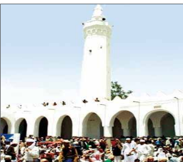
لا تخلف الميعاد.

هو معاذ بن جبل بن عمرو بن أوس، يكنى أباً عبد الرحمن، وأسلم وهو ابن ثمانين سنة، وشهد العقبة مع السبعين وبدراً والمشاهد كلها مع رسول الله، وأراده رسول الله وراءه، وبعثه إلى اليمن بعد غزوة تبوك وشيعه ماشياً في مخرجه وهو راكب، وكان له من الولد عبد الرحمن وأم عبد الله وولد آخر لم يذكر اسمه.