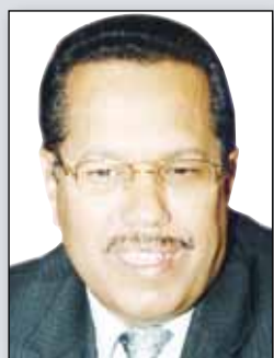
تأليف: د. أحمد عبيد بن دغر

أما ما يتعلق بالقروض والمساعدات الخارجية فقد أوضح الدكتور أحمد عبيد بن دغر أن صراع القوى وسياسة الحرب الباردة بعد الحرب العالمية الثانية جعل اليمن محطة من محطات هذا الصراع بفضل موقعه الاستراتيجي وثرواته المعدنية المرتقبة، وسوقه التجاري، ولهذا أدرك الإمام حاجته لإقامة علاقات تعاون متوازنة مع أطراف هذا الصراع، وحاجة هذه الأطراف الى موطن قدم في اليمن، منوهاً إلى أن الإمام قد تمكن من استثمار هذه العلاقات في الحدود التي كان يريدتها وبالمدى الذي ذهبت إليه. مشيراً إلى أن القروض والمساعدات شكلت مصدراً وحيداً لمشاريع التنمية التي بدأ الأئمة تنفيذها بعد انقلاب ١٩٥٥م، فقد بلغ حجم القرض السوفيتي لليمن مائة مليون روبل استخدم منها ٦٠ مليون روبل لإنشاء ميناء الحديدية.. وقد توجس الأميركيون خيفة من المساعدات السوفيتية لليمن فبادروا بتقديم المعونات الى اليمن وقد بلغت ١٦,٦٠٠ مليون دولار وصدت لتنفيذ طريق وسد في تعز ودخل الصيبيون على خط المنافسة بين السوفييت والأمريكان من خلال قرض بلغ حجمه ٧ ملايين فرنك فرنسي لتنفيذ طريق الحديدية - صنعاء.