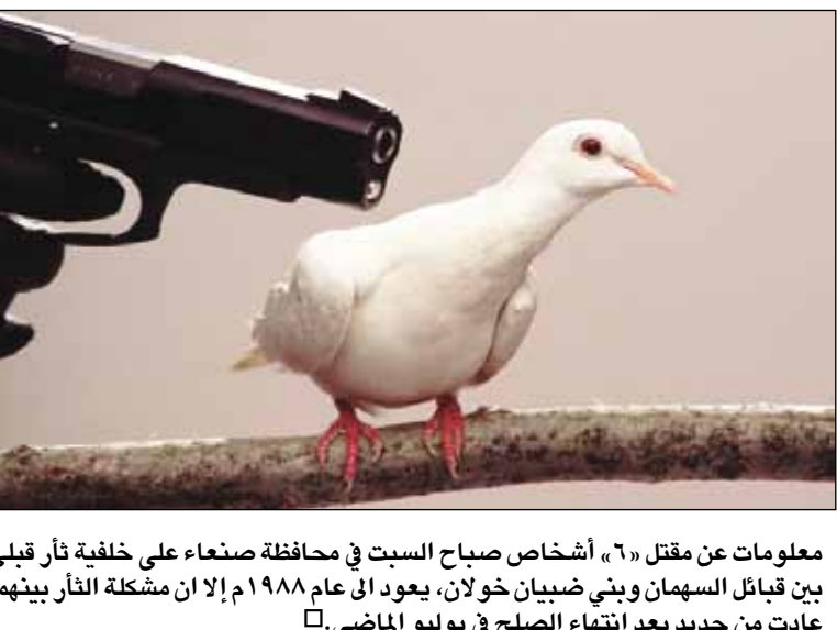
معلومات عن مقتل «٦» أشخاص صباح السبت في محافظة صنعاء على خلفية ثأر قبلي بين قبائل السهمان وبني ضبيان خولان، يعود إلى عام ١٩٨٨م إلا أن مشكلة الثأر بينهما عادت من جديد بعد انتهاء الصلح في يوليو الماضي. □