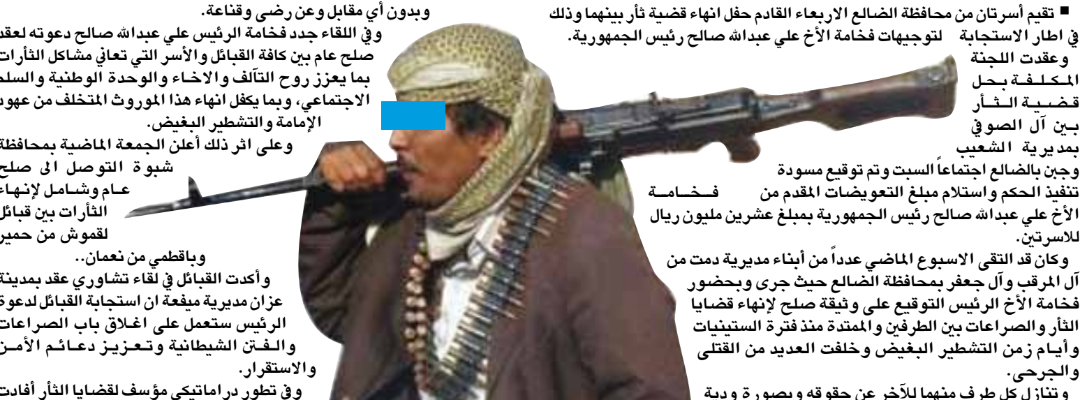
تقيم أسرنا من محافظة الضالع الاربعة القادم حفل انهاء قضية ثأر بينهما وذلك في اطار الاستجابية لتوجيهات فخامة الأخ علي عبدالله صالح رئيس الجمهورية. وعقدت اللجنة المكلفة بحل قضية الثأر بين آل الصوفي بمديرية الشعبي وجبن بالضالع اجتماعاً السبت وتم توقيع مسودة تنفيذ الحكم واستلام مبلغ التعويضات المقدم من فخامة الأخ علي عبدالله صالح رئيس الجمهورية بمبلغ عشرين مليون ريال للآسرتين. وكان قد التقى الاسبوع الماضي عدداً من أبناء مديرية دمت من آل المرقب وآل جعفر بمحافظة الضالع حيث جرى وبحضور فخامة الأخ الرئيس التوقيع على وثيقة صلح لإنهاء قضايا الثأر والصراعات بين الطرفين والممتدة منذ فترة الستينيات وأيام زمن التشطير البغيض وخلفت العديد من القتلى والجرحى. وتنازل كل طرف منهما للأخر عن حقوقه وبصورة ودية