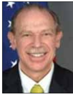
جبريل فاير ستاين

الاتحاد الأوروبي: خطوة نحو الأمام وسنواصل دعمنا للإصلاحات في اليمن