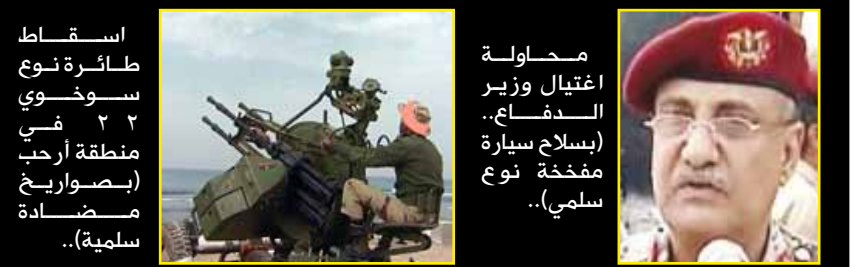
ضرب الامن المركزي بقذيفة هاون نوع (سلمية سلمية)..