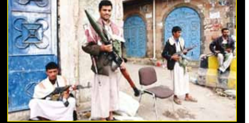
فهل يعي الشباب الذين يحملون جميع أنواع الاسلحة السلمية في ساحة السلمية.. كيف سقط هؤلاء!!