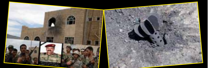
ضرب الامن المركزي بقذيفة هاون نوع (سلمية سلمية).. ضرب اللواء ٦٣ مشاه جبلي وقتل قائده ومجموعة من الضباط والجنود..

تستمر الفعاليات السلمية حيث تم خلال الأربعة أيام: