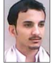
اللورد أسد يمانى

الحكومة مهمة بشحنة الاسلحة الايرانية أكثر من الشحنات التركية طيب ... كلنا عارفين أن الشحنة الايرانية كانت متجهة للحوثيين ، بس ممكن نعرف الشحنات التركية لمن كانت متجهة!!