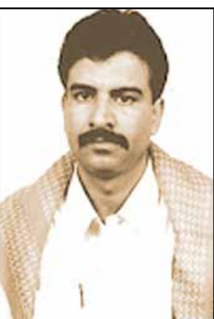
المهرة: ناصر الساکت

كُلف محافظ المهرة/ علي محمد خوادم وكيل المحافظة لشؤون مديريات الساحل بالجلوس مع المسؤولين بالمديريات ومسئولي هيئة المصائد السمكية والأجهزة الأمنية بالمحافظة للوقوف تجاه مخالفات الإصطياد العشوائي الجائر المخالف لقانون الصيد التقليدي رقم (٢) لسنة ٢٠٠٦م ومنها الإصطياد بشباك الشرطونات التي تلحق ضرراً كبيراً بالثروة السمكية والمخزون السمكي في سواحل المحافظة.