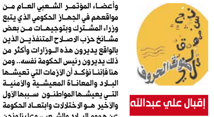
إقبال علي عبدالله

وأعضاء المؤتمر الشعبي العام من مواقعهم في الجهاز الحكومي الذي يتبع وزراء المشترك ويتوجهات من بعض مشائخ حزب الإصلاح المتنفذين الذين بالواقع يديرون هذه الوزارات وأكثر من ذلك يديرون رئيس الحكومة نفسه.. ومن هنا فإننا نؤكد أن الأزمات التي تعيشها البلاد والمعاناة المعيشية والأمنية التي يعيشها المواطنون سببها الأول والأخير هو الاختلالات وابتعاد الحكومة عن هموم البلاد والشعب، وعلينا ونحن نشاهد ونسمع يومياً عمليات القتل والتفجيرات التي تجري في عموم أنحاء البلاد بما فيها العاصمة صنعاء، حيث مقر الحكومة والجهاز الأمني.. علينا أن نتهم تنظيم القاعدة الإرهابي فقط، وإن كان دوره واضحاً في هذه العمليات الإجرامية والتخريبية.. بل علينا أن نوجه التهمة متساوية ضد الحكومة التي بيدها الجهاز الأمني الذي يتعزى في كوادره ومنتسبيه إلى هذه الأعمال وتكون بيانات الحكومة أن الفاعل هو تنظيم القاعدة وكان البلاد ليس فيها جهاز أمني مسلح ومدرب وجهاز استخبارات، ويعرف الجميع ما دور هذا الجهاز في هذه الفترة.