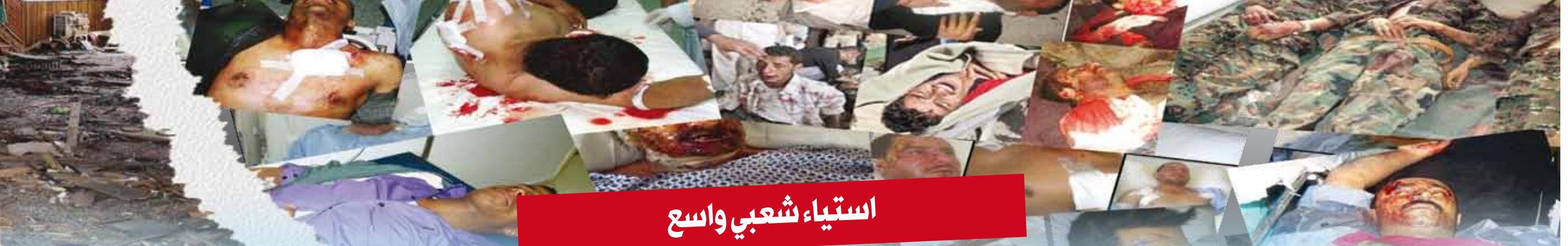
استياء شعبي واسع