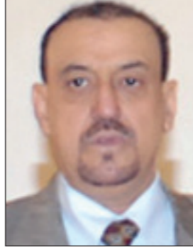
بـقلم / سلطان سعيد البركاني

وأمنه واستقراره.. لله الحمد أن فخامة رئيس الجمهورية ورئيس مؤتمر الحوار قد استمع وقرأ بإمعان خلال جلستين امتدت لـ 8 ساعات تقريباً إلى ملاحظات المؤتمر الشعبي العام ومخاوفه وللازراء القانونية العربية والإوروبية واستخلص منها النقاط الأربع (4) التي صدرت.. فله منا جميعاً الشكر والتقدير ومن كل أبناء هذا الوطن مقدرين ما صنع..