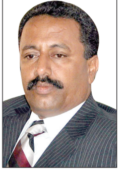
بقلم / عارف عوض الزوكا

أما على المستوى الحزبي فقد كان شعلة من النشاط والحيوية ومثالاً للإخلاص والتفاني فقد لعب دوراً متميزاً في تعزيز العمل التنظيمي والسياسي للمؤتمر الشعبي العام من خلال المواقع