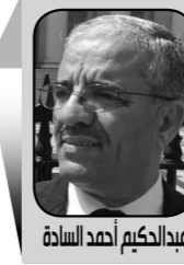
عبدالحكيم أهد السادة