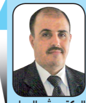
الدكتور بشير العماد

3 - قرار نقل البنك المركزي اليمني إلى عدن هو قرار اتخذته دوائر سياسية دولية أكبر من حجم الدبوع وبن دغر ومن معهما، وهو ما صرح به السفير البريطاني للوفد الوطني في الكويت أنه في حالة عدم التوقيع على الاتفاق سيتم البدء بالإجراءات والعقوبات الاقتصادية .