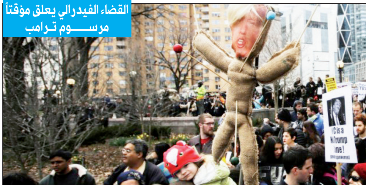
القضاء الفيدرالي يعلق مؤقتاً مرسوم ترامب

الذي عطل مرسوم الرئيس الأمريكي دونالد ترامب حول حظر دخول الولايات المتحدة مؤقتاً لمواطني بعض الدول.