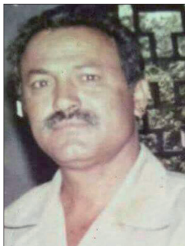
باليل راجح لبوزه